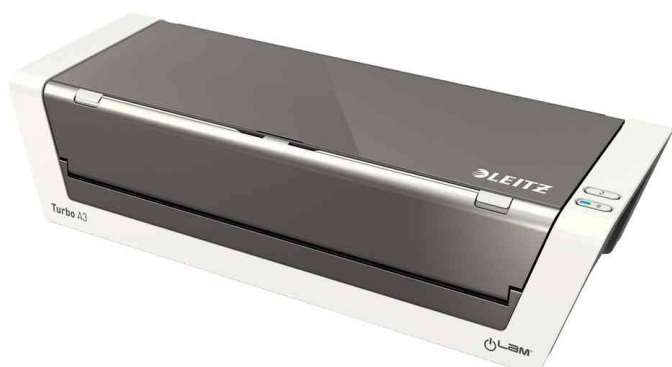
Plastifieuse iLam Touch 2 Turbo A3, fermé