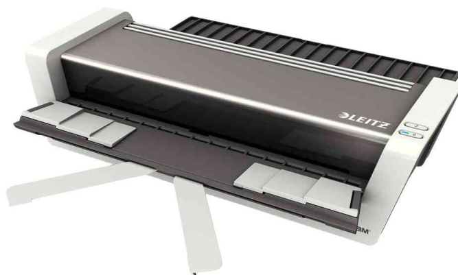
Plastifieuse iLam Touch 2 Turbo A3, avec des plateaux de rangement dépliés