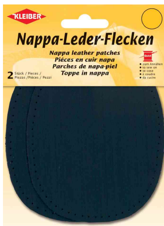
Patch en cuir nappa oval, bleu foncé