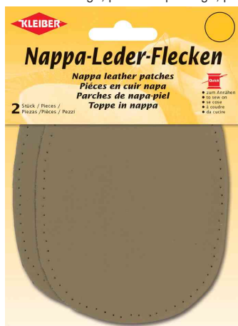
Patch en cuir nappa oval, beige

Lavage à la main jusqu'à max. 40 °C dans de l'eau tiède savonneuse, sans détergents agressifs, rincer à l'eau claire, essorer et bien aplatir, pas de javel, pas de séchage au sèche-linge, pas de repassage, pas de nettoyage à sec