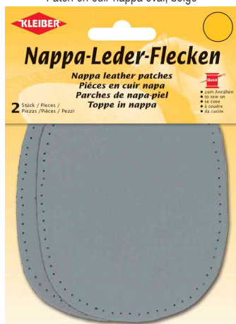
Patch en cuir nappa oval, gris clair