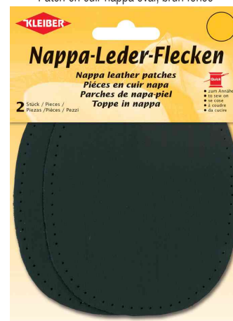
Patch en cuir nappa oval, noir