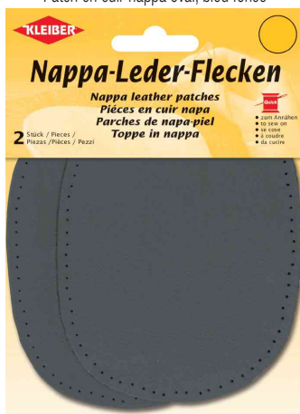
Patch en cuir nappa oval, gris foncé