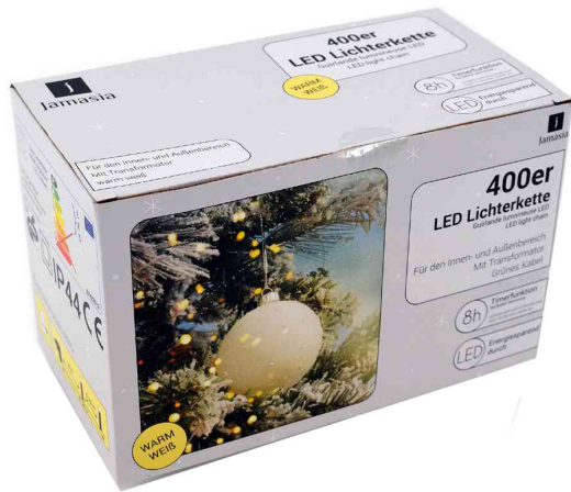
Guirlande lumineuse LED, 400 ampoules