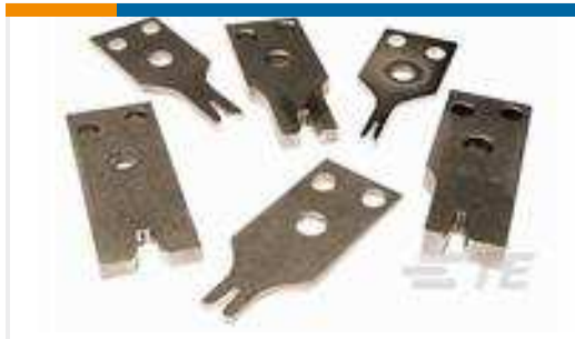
TE Teilnr.:1-456134-9 CRIMPER, INSULATION "F"(.130")