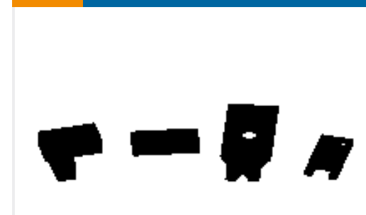
TE Teilnr.:240644-1 PLATE-REAR SHEAR