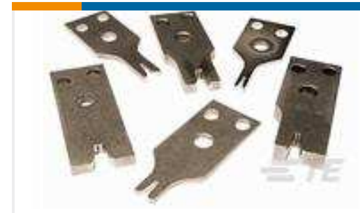
TE Teilnr.:4-456134-8 CRIMPER, INSULATION "F"(.100")