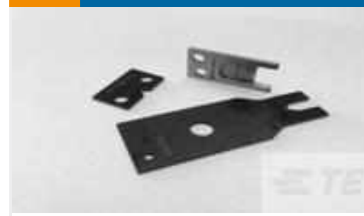
TE Teilnr.:691157-3 BLADE, SHEAR