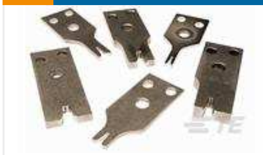
TE Teilnr.:456406-2 CRIMPER-WIRE .090 F