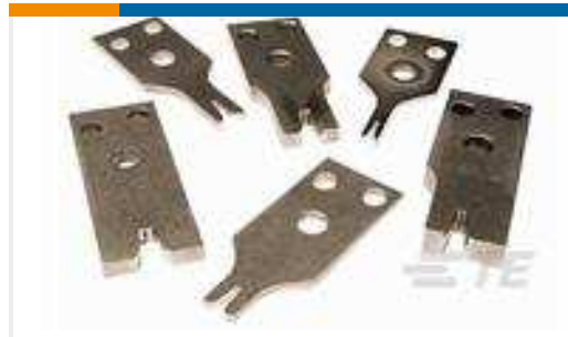
TE Teilnr.:456134-6 CRIMPER, INSULATION "F"(.180")