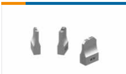
ANVIL REPRESENTATION ONLY TE Teilnr.:4-690512-0 COMB ANVIL