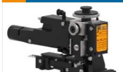
TE Teilnr.:2836993-2 OCEAN_2.0_Applicator-S-046F0590A