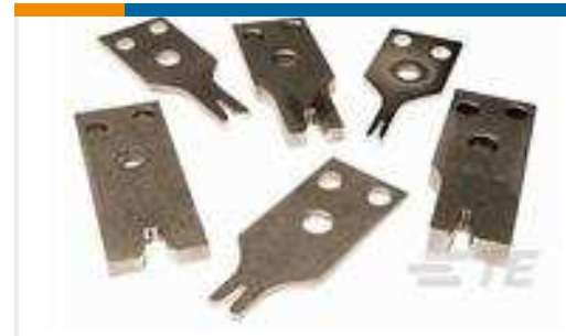
TE Teilnr.:4-456134-4 CRIMPER, INSULATION "F"(.130")