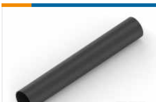
TE Teilnr.:NB08994001 ATUM-12/3-0-SP