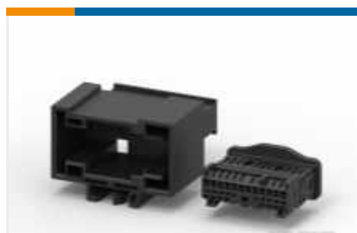
TE Teilnr.:1534100-1 MQS, STECKVERBINDERGEHÄUSE