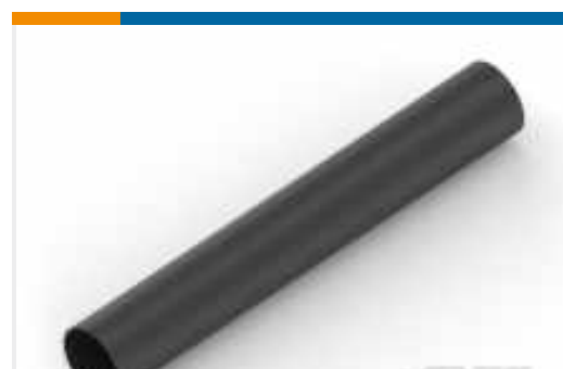
TE Teilnr.:NB09944001 ATUM-19/6-0-SP