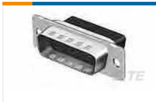
TE Teilnr.:1658642-2 PLUG ASSY,9P,HDP-20,CN