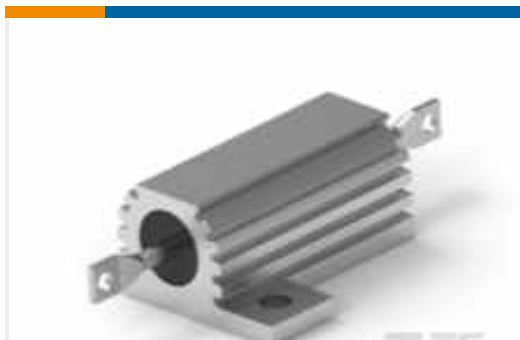
TE Teilnr.:3-1879073-0 Leistungswiderstand: Aluminiumgehäuse, 75 Watt