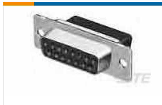
TE Teilnr.:205209-2 RECP ASSY SIZE 4