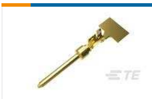
TE Teilnr.:66506-3 20 DF PIN