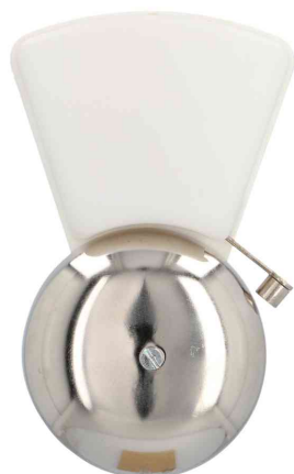
Sonnette, à deux bobines