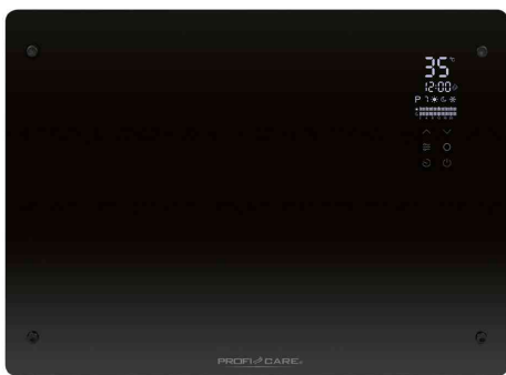
Glas-Konvektorheizung PC-GKH 3118, schwarz