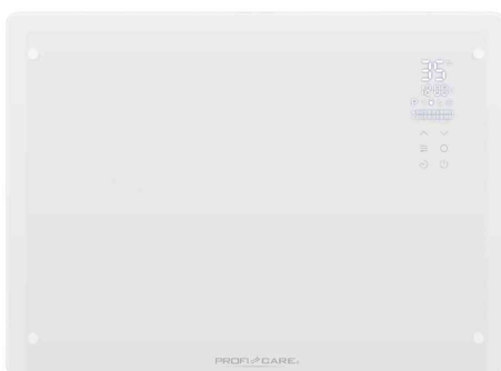
Glas-Konvektorheizung PC-GKH 3118, weiß