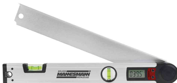
Rapporteur d'angle numérique