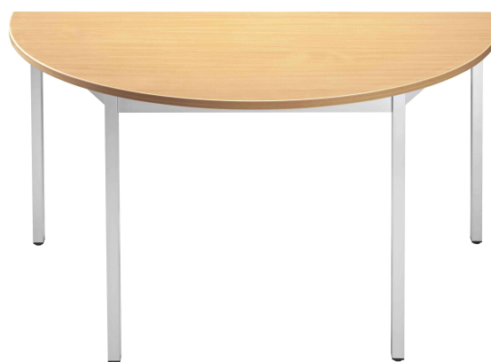
Visuel de référence: Table de réunion modulaire, demi-rond, hêtre