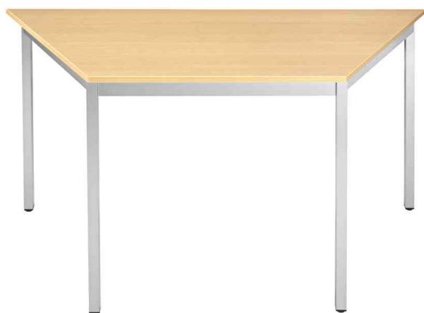
Visuel de référence: Table de réunion modulaire, trapézoïdale, hêtre