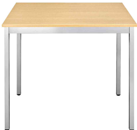
Visuel de référence: Table de réunion modulaire, rectangulaire, hêtre

- idéal dans les salles de repos, les salles d'attente et les cantines etc.