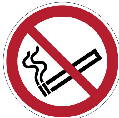
Panneau d'interdiction "Défense de fumer"