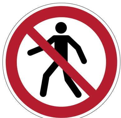
Panneau d'interdiction "Interdit aux piétons"