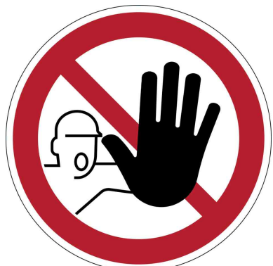
Panneau d'interdiction "Accès interdit"