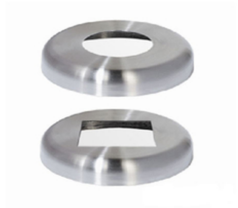
Modellbeispiel: Fußabdeckung für Edelstahl-Sperrpfosten (Art. 13674 u. 13675)