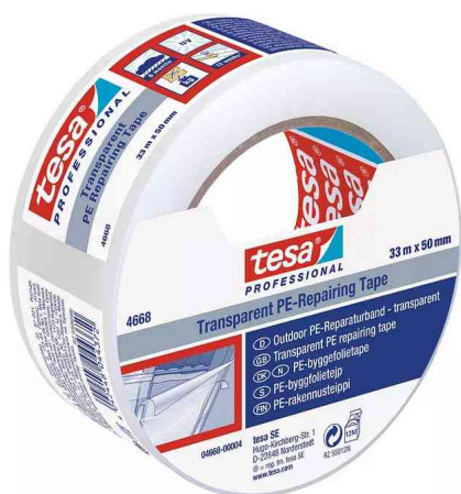
Ruban adhésif pour films 4668 MDPE