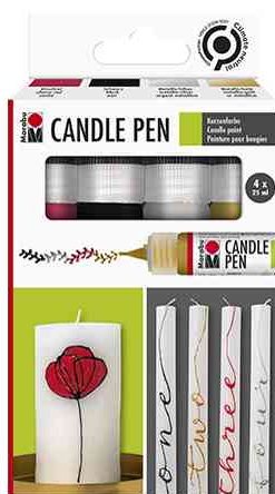
Peinture pour bougies "Candle Pen", set de 4