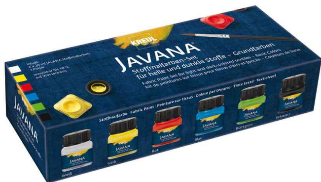
Textilfarbe JAVANA, Creativset Basic-Set