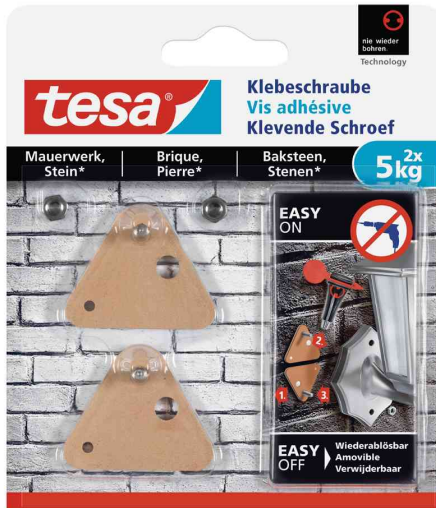
Klebeschraube - für Mauerwerk & Stein, 2 x 5,0 kg