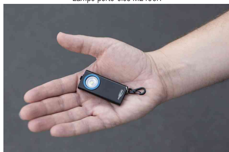
Visuel de référence : montre la taille