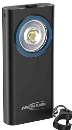
Lampe porte-clés ML400R