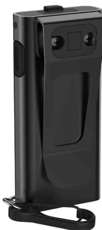
Lampe porte-clés ML400R