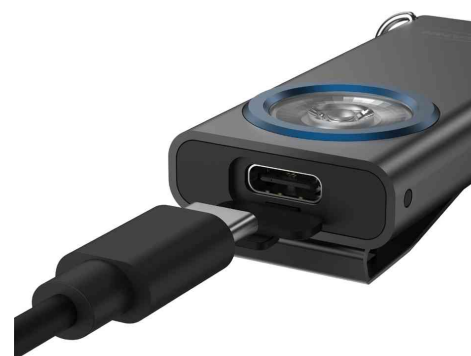
Visuel de référence : montre la simplicité de chargement