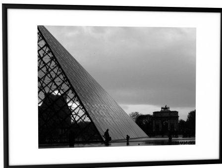
Visuel de référence: Utilisation en format paysage