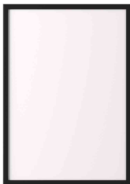
Visuel de référence: Cadre photo en aluminium