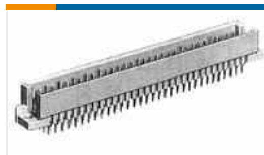
TE Teilnr.:536019-5 0% EURO TYP R PIN AP MFBL ASY