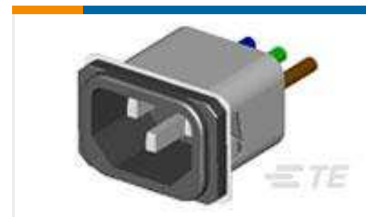
TE Teilnr.:5-1609987-6 15SRBX8=F8287