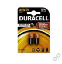
Duracell MN21 BG2