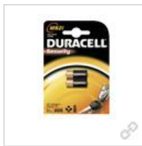
Duracell MN21 BG2