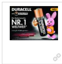
Anzeigenvorlage Duracell 'Die Batteriemarke Nr. 1 Weltweit'