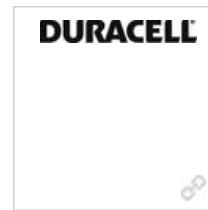
Logo DURACELL schwarz