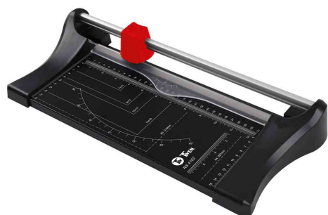
Rogneuse RS 4102