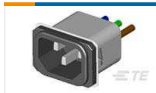
TE Teilnr.:5-1609987-6 15SRBX8=F8287