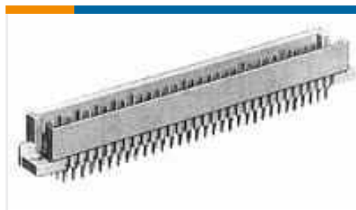
TE Teilnr.:536019-5 096 EURO TYP R PIN AP MFBL ASY