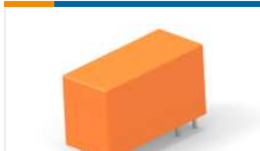
TE Teilnr.:2-1649329-2 RTE44012