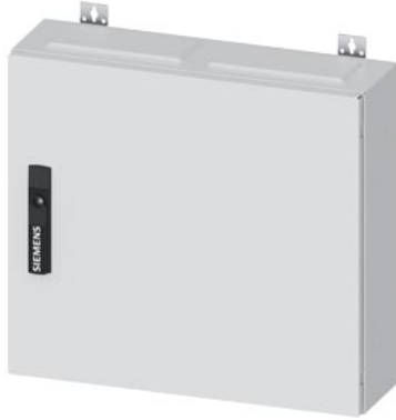
ALPHA 160 DIN Wandverteiler Aufputz mit Verteilerfeld, IP44, Schutzklasse 2 H=500mm, B=550mm, T=140mm RAL 9016