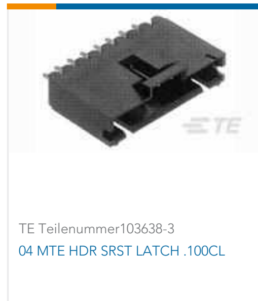
TE Teilenummer103638-3 04 MTE HDR SRST LATCH .100CL