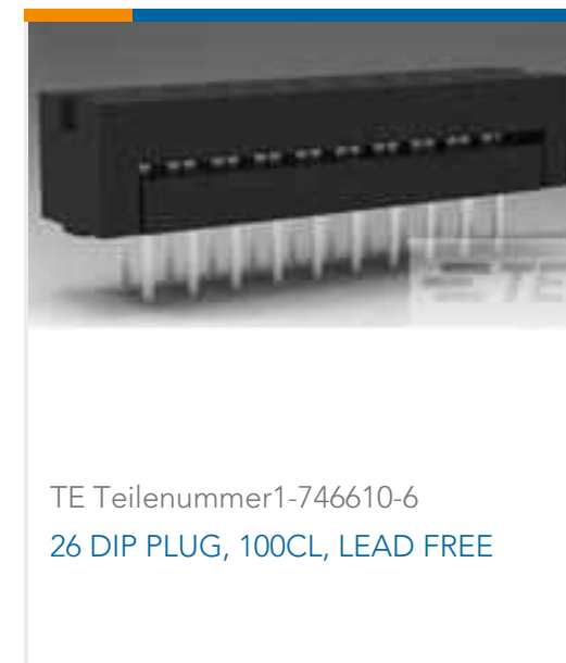
TE Teilenummer1-746610-6 26 DIP PLUG, 100CL, LEAD FREE