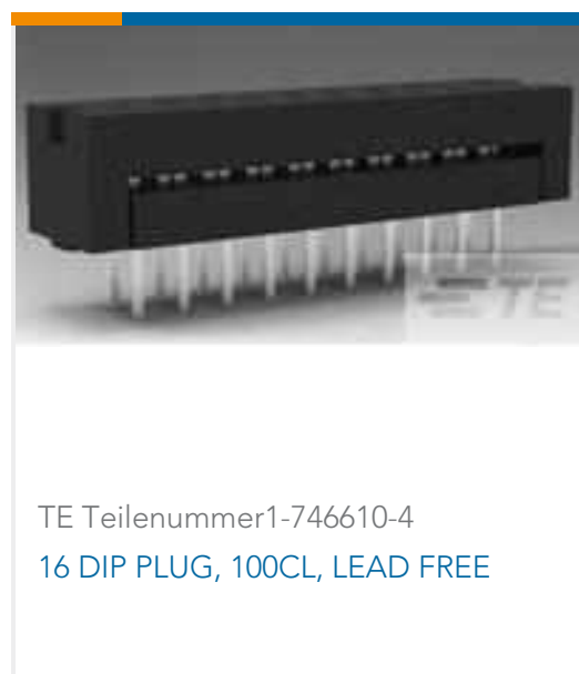
TE Teilenummer1-746610-4 16 DIP PLUG, 100CL, LEAD FREE