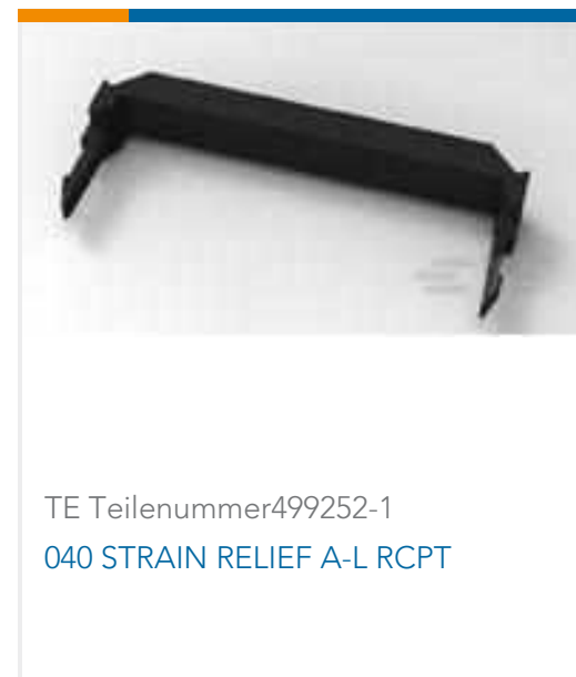
TE Teilenummer499252-1 040 STRAIN RELIEF A-L RCPT