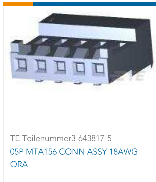
TE Teilenummer3-643817-5 05P MTA156 CONN ASSY 18AWG ORA