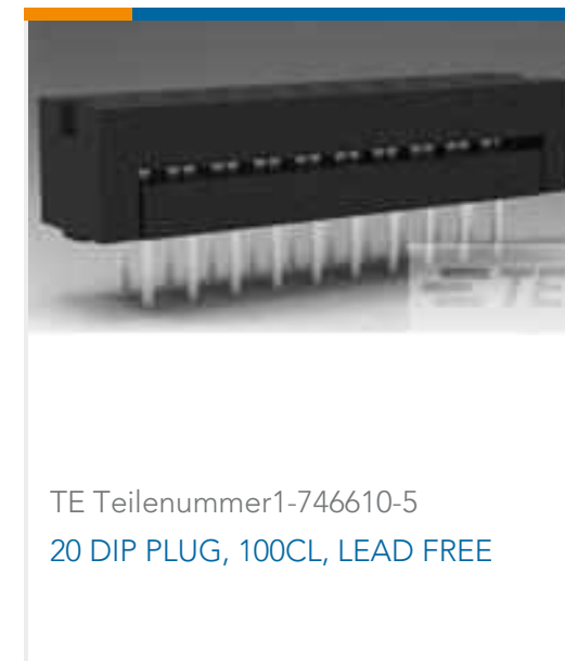
TE Teilenummer1-746610-5 20 DIP PLUG, 100CL, LEAD FREE