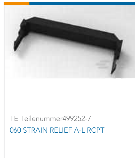
TE Teilenummer499252-7 060 STRAIN RELIEF A-L RCPT