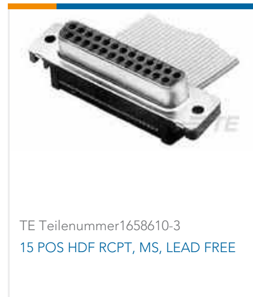
TE Teilenummer1658610-3 15 POS HDF RCPT, MS, LEAD FREE