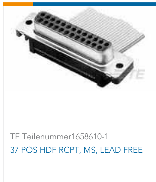
TE Teilenummer1658610-1 37 POS HDF RCPT, MS, LEAD FREE