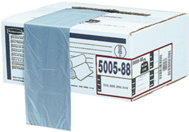
Detailansicht: Abfallsäcke -Polyliner- mit Verpackung