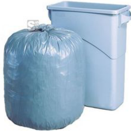
Anwendungsbeispiel: Abfallsäcke 170 Liter (Art. 12513)