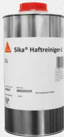
Sika Haftreiniger-1 (1754)