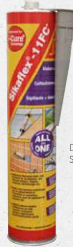
Dichtungsmasse Sikaflex-11FC+ (1756)