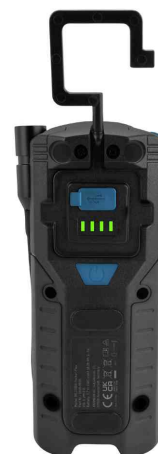
Lampe de travail LED à batterie WL1500R Pocket Flex, vue de dos