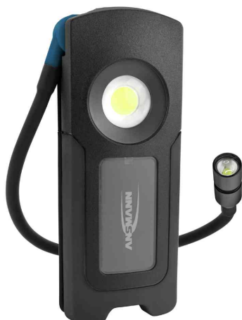
Lampe de travail LED à batterie WL1500R Pocket Flex