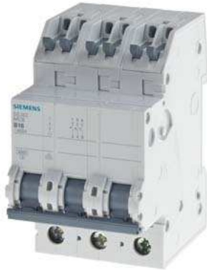
Leitungsschutzschalter 400V 6kA, 3-polig, B, 16A, T=70mm mit schraubenlosen Abgangsklemmen