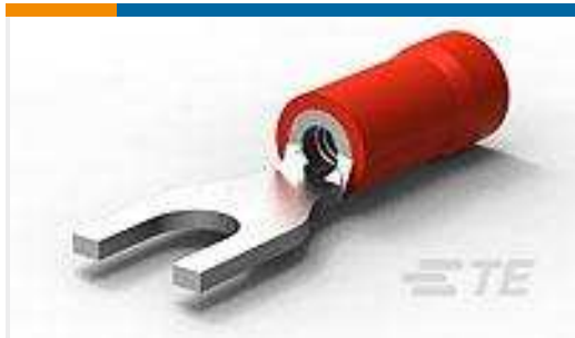
TE Teilenummer342117-1 22-16 F.E.P.G. SPADE 4BA STUD