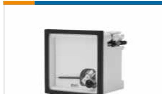
TE TeilenummerD31415-000 CI-E243-41SGRNAJAJ