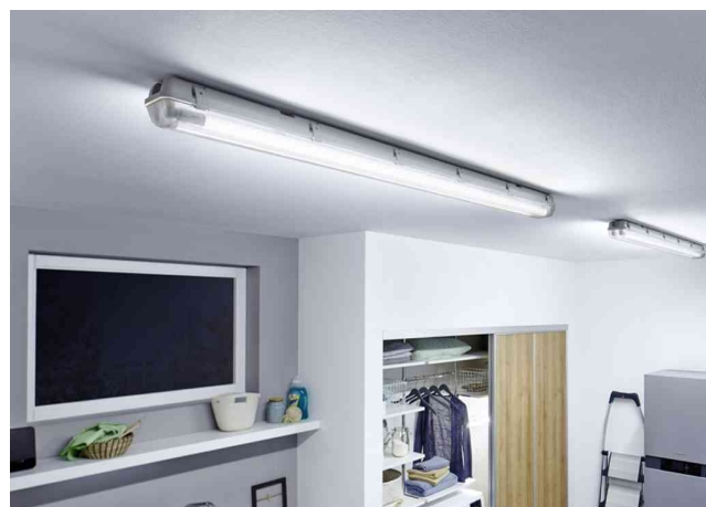
Exemple d'utilisation dans une buanderie