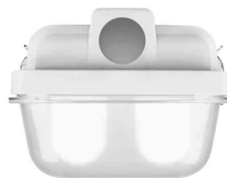
Modèle pour 2 lampes LED T8