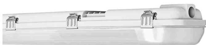
Luminaire pour locaux humides DAMP PROOF HOUSING