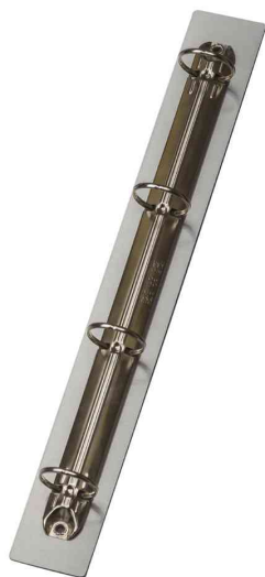
Support d'affichage magnétique avec 4 anneaux