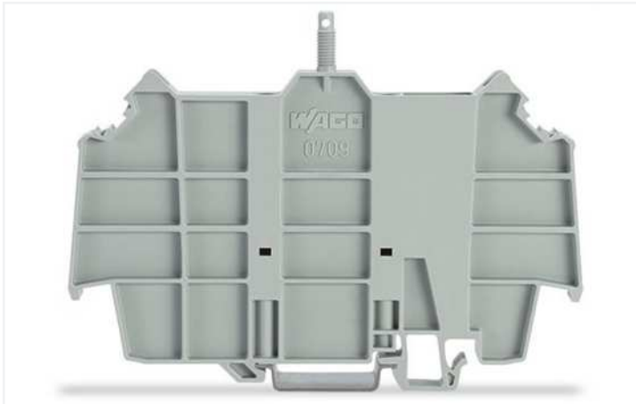
Farbe: ■ grau