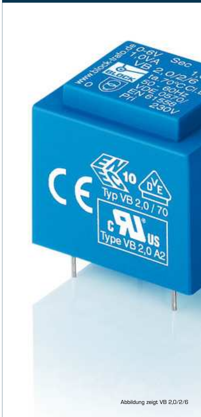
Abbildung zeigt VB 2,0/2/6