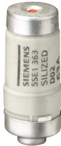
SILIZED-SICHERUNGSEINSATZ 400V GR, HALBLEITERSCHUTZ GR.D02 63A