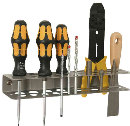
5) Porte-outils "StorePlus Flex M 31" - livré non équipé