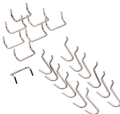
2) Jeu de crochets "StorePlus Flex M 20"