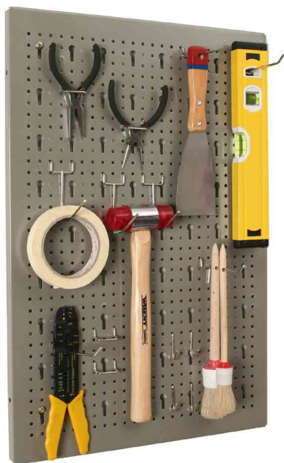
1) Panneau perforé porte-outils "StorePlus Flex M 60" - livré non équipé