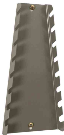
4) Barrette porte-clés plates "StorePlus Flex M 8"