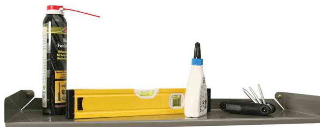
7) Étagère murale StorePlus Flex M 58" - livrée non équipée