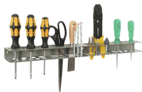
6) Porte-outils "StorePlus Flex M 62" - livré non équipé