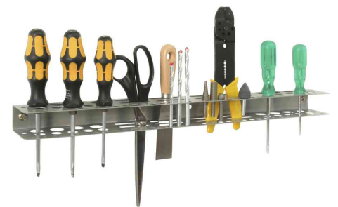
6) Werkzeughalter "StorePlus Flex M 62" - Lieferung unbestückt