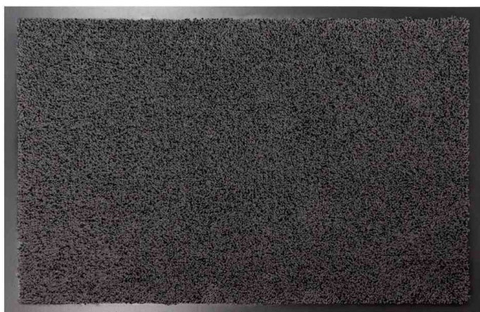
Tapis anti-salissure COSMOS, anthracite