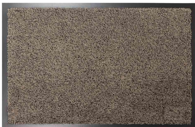
Tapis anti-salissure COSMOS, taupe