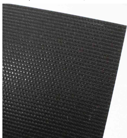
Visuel de référence : montre le dos