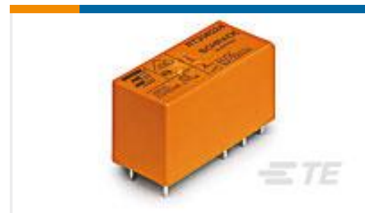
TE Teilnr.:5-1393243-4 RT424F12