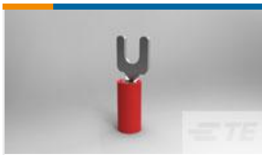
TE Teilnr.:34541 PIDG SPD 22-16 COMM 22-18MIL 6