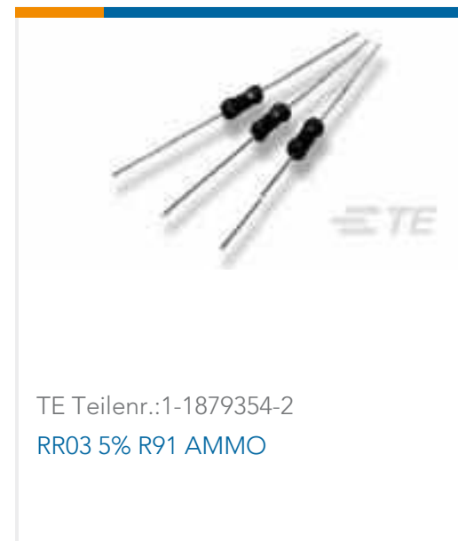
TE Teilnr.:1-1879354-2 RR03 5% R91 AMMO