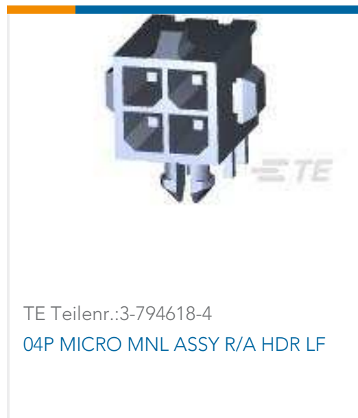
TE Teilnr.:3-794618-4 04P MICRO MNL ASSY R/A HDR LF