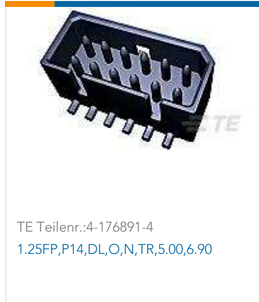
TE Teilnr.:4-176891-4 1.25FP,P14,DL,O,N,TR,5.00,6.90