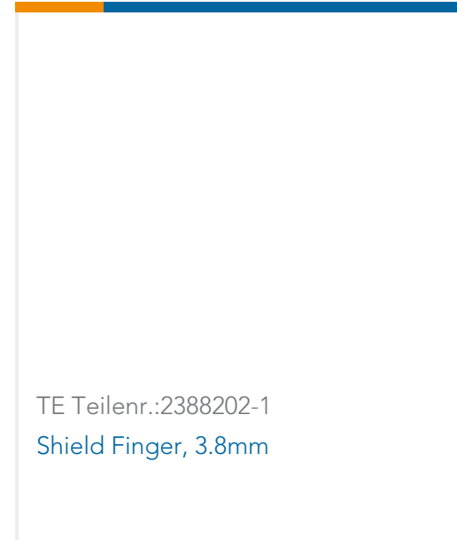
TE Teilnr.:2388202-1 Shield Finger, 3.8mm