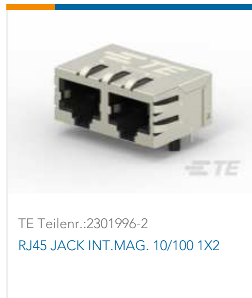
TE Teilnr.:2301996-2 RJ45 JACK INT.MAG. 10/100 1X2