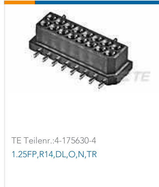
TE Teilnr.:4-175630-4 1.25FP,R14,DL,O,N,TR