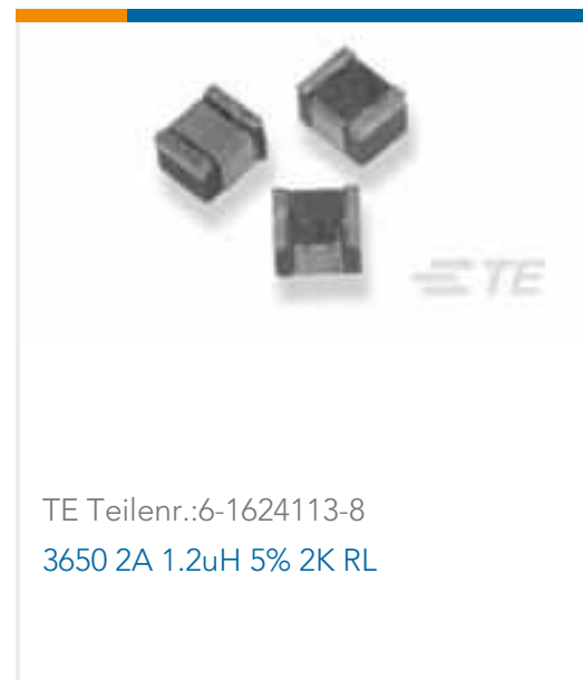
TE Teilnr.:6-1624113-8 3650 2A 1.2uH 5% 2K RL