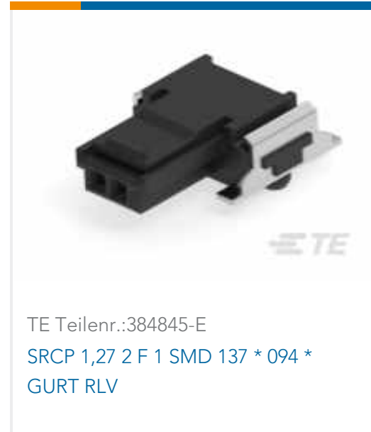
TE Teilnr.:384845-E SRCP 1,27 2 F 1 SMD 137 * 094 * GURT RLV