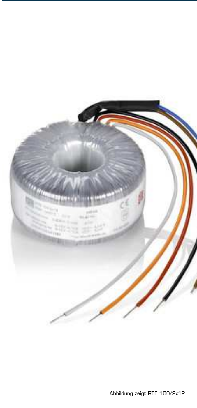
Abbildung zeigt RTE 100/2x12