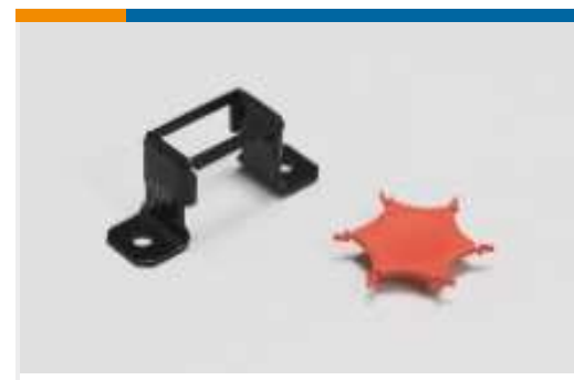
Montage- und Arretierzubehör für Schraubklemmen und Strips(1)