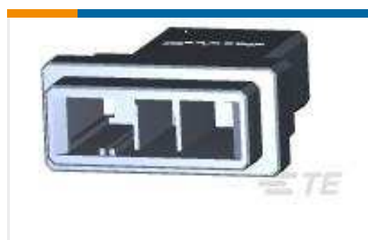
TE Teilenummer2-179552-3 DYNAMIC D-3200 WTW TAB HSG 3P