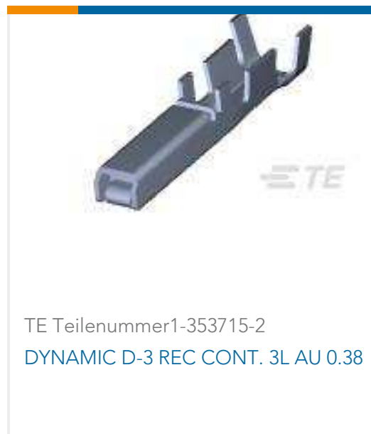
TE Teilenummer1-353715-2 DYNAMIC D-3 REC CONT. 3L AU 0.38