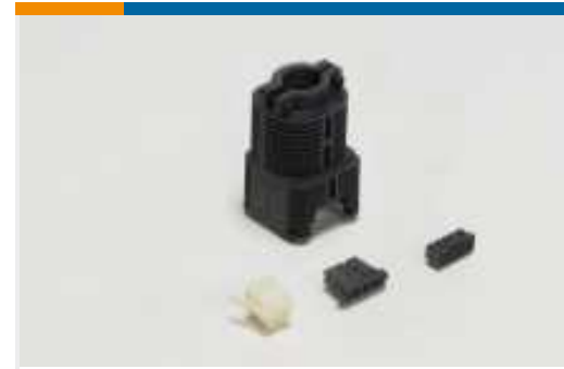
Rechteckige Steckverbindergehäuse (134)