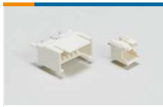
Draht-an-Leiterplatte-Steckkontakte und -sockel(14)