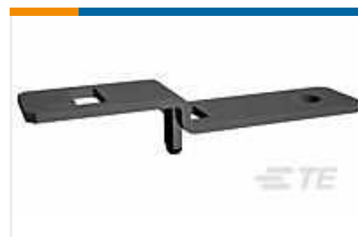
TE Teilenummer5900121-4 DYNAMIC D-3 FREE HANGING HOOK