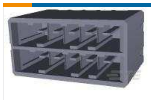
TE Teilenummer2-917657-2 DYNAMIC D-3200 HDR ASSY 10P