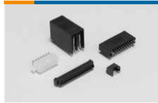
Rechteckige Standardsteckverbinder (285)