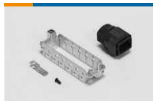
Zubehör für rechteckige Steckverbinder(7)