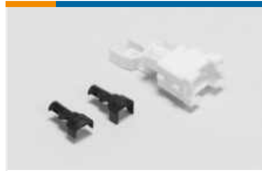
Rechteckige Abdeckkappen und Kabelklemmen(2)