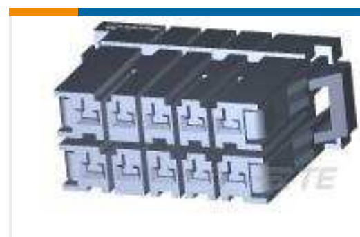
TE Teilenummer2-917659-5 DYNAMIC 3200 D/ROW REC HSG 10P