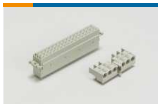
Steckverbindergehäuse für Backplanes (2)