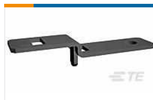
TE Teilenummer5900121-2 DYNAMIC D-3 FREE HANGING HOOK