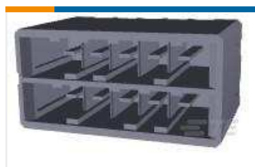
TE Teilenummer3-917657-2 DYNAMIC D-3200 HDR ASSY 10P