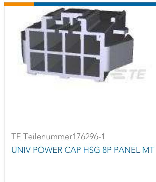
TE Teilenummer176296-1 UNIV POWER CAP HSG 8P PANEL MT