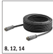
8, 12, 14