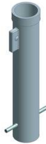
Technische Ansicht: Bodenhülse aus Stahl mit Schnellverriegelung und Dichtungsring Art. bs00060