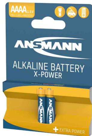
Pile alcaline "X-Power" AAAA, blister de 2

- idéal pour les appareils haute technologie comme par ex. les appareils de mesure médicaux, casque micro, alarme automatique pour véhicules, pointeur laser, petites télécommandes etc.