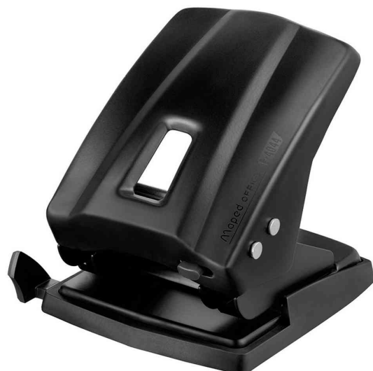
Locher Essentials E4044