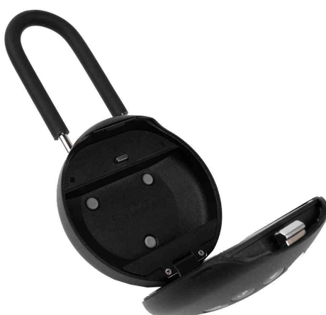
Boîte à clés PALM KS0213ES, avec anse de cadenas