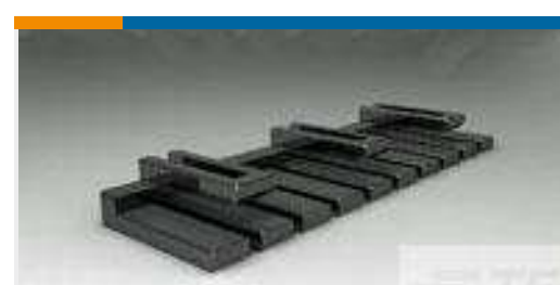
TE Teilnr.:1-1969443-0 EP 2.5 TPA Retainer, 10 Pos