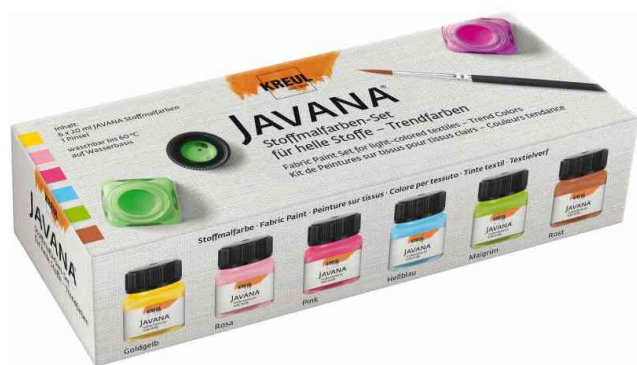
Textilfarbe JAVANA, Trendfarben-Set