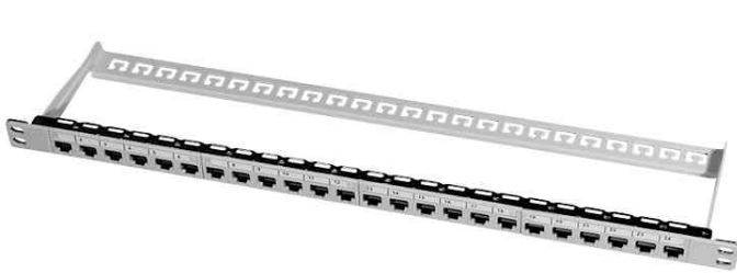
19" Modular Patch Panel Kat. 6A, lichtgrau

- erlaubt es zwei Panels zusammen zu Benutzen um 48 Keystone Module in nur einer Höheneinheit unterzubringen, da das Panel nur 0,5 HE hoch ist