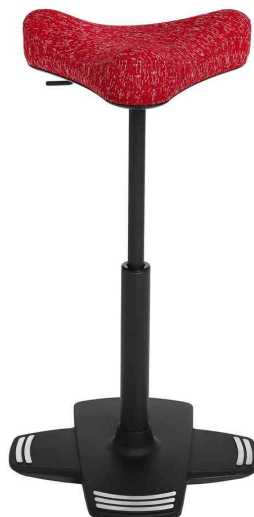
Sitzhocker / Stehhilfe "Sitness Work High", rot