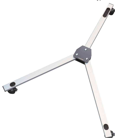
Socle à roulettes universel