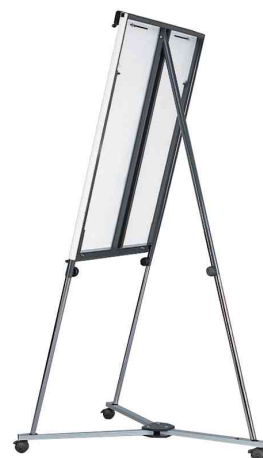
Socle à roulettes universel - exemple d'application